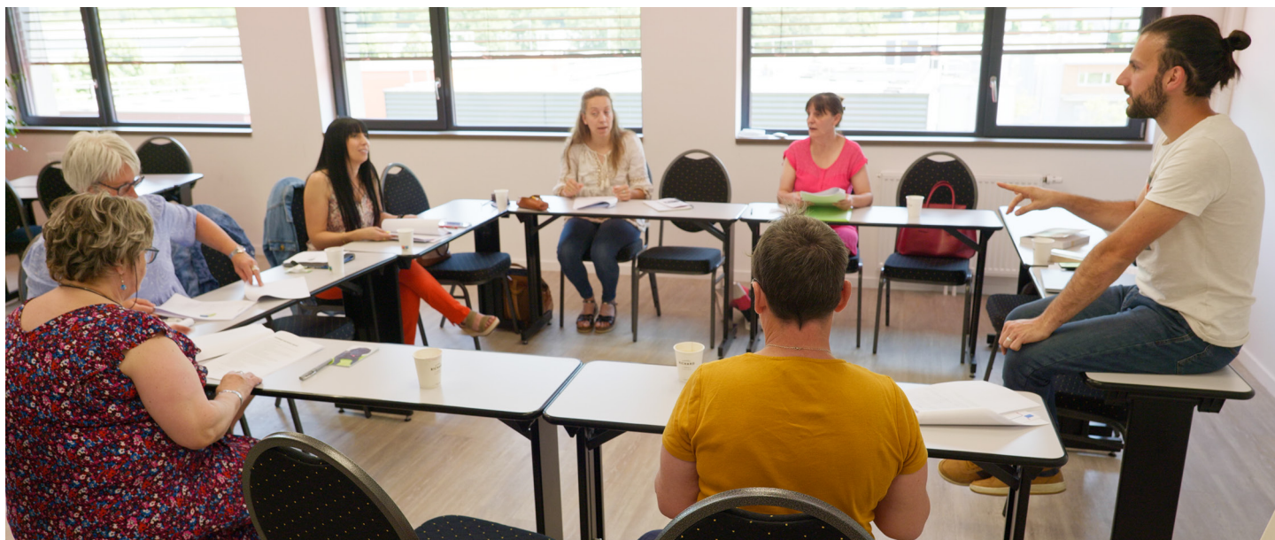
Toutes nos formations ont lieu dans nos locaux rue La Fayette à Besançon : plus de 300 m 2 dédiés à la formation avec cinq salles équipées.

Nous accompagnons les professionnels libéraux dans leurs obligations comptables et fiscales /// Nous initions les artisans et commerçants au pilotage d'entreprise pour une mise en place de bonnes pratiques de gestion /// Nous apportons les règles de bases aux loueurs en meublés pour une optimisation de leur fiscalité.